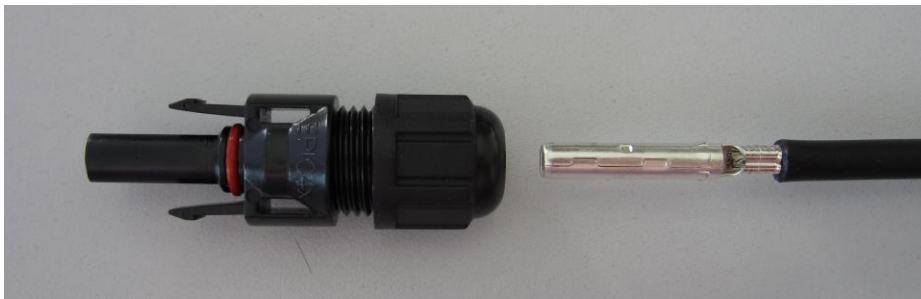
(EPIC® SOLAR 4 F)

Den angecrimpten Kontakt in die geöffnete Verschraubung einführen bis der Kontakt mit einem „Click“ einrasten. Durch leichten Zug am Kabel prüfen, ob der Kontakt richtig eingerastet ist. Hutmutter mit 2,8 Nm zudrehen– Fertig