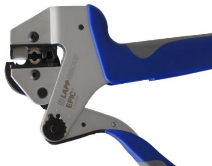
Crimpzange CSC montiert

Crimpzange ( 11147000) mit Crimpeinsatz (z.B. 44428995) und Locator (44428996) zum Crimpen der EPIC® SOLAR Kontakte: